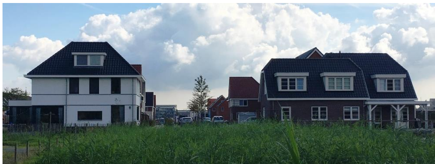
Voorbeeld van vrije kavels aan het water in Boskoop

Zijgevel (oost): Detail t.p.v. een standaard beschoeiing incl. positie gevelrooilijn